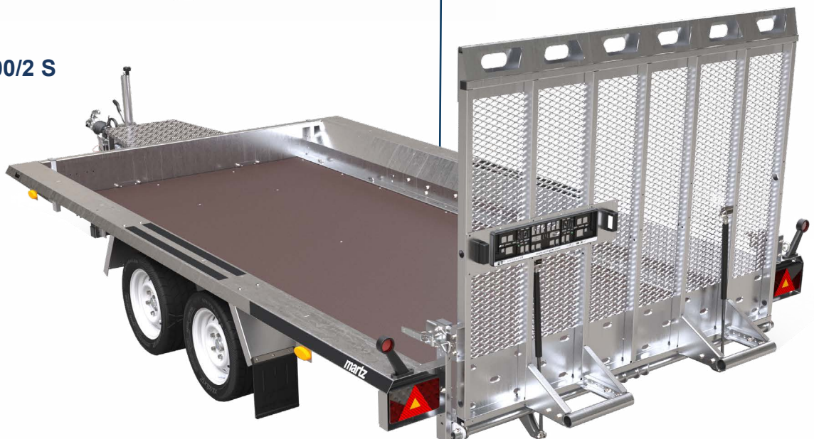
BAU-3 400/2 S