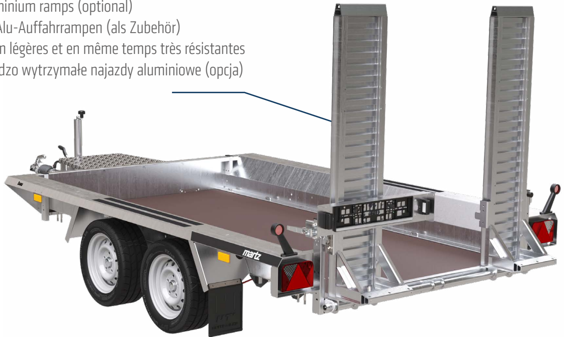
BAU-3 300/2 S